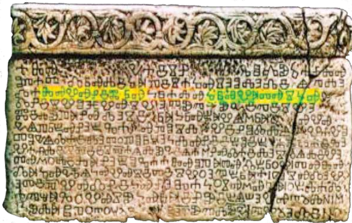
Natpis na Bašćanskoj ploči