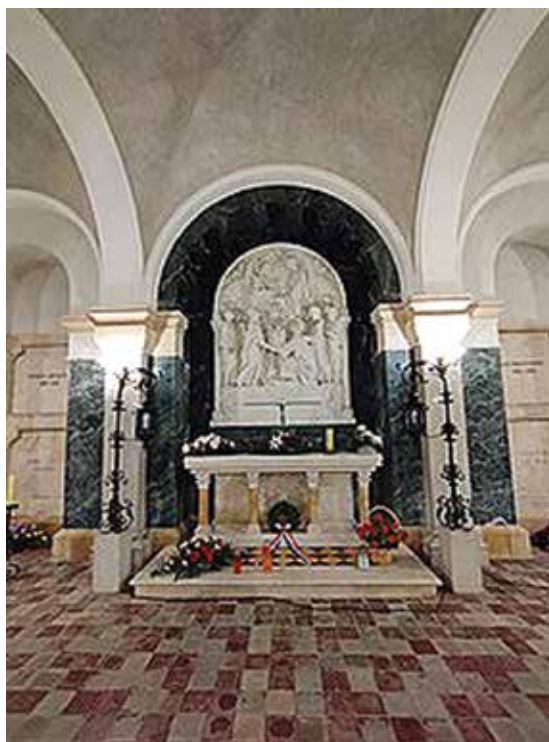
Posljednje počivalište biskupa Strossmayera u kripti đakovačke katedrale

Sjajni nastupi i briljantni govori hrvatskog prelata na Prvom vatikanskom saboru (1869.–1870.) pribavit će mu izuzetan ugled u katoličkom svijetu, pa i šire, ali ga osobna slava i popularnost neće zaustaviti u iskrenom nastojanju da hrvatski narod bude otvoren prema drugima, prije svega prema slavenskim narodima. Kao pripadnik naroda baštinika zapadne i istočne kršćanske civilizacije i kulture, ali i Metodov nasljednik na stolici sirmijskih biskupa, đakovački biskup je istinski preteča modernih ekumen-skih traženja puta k jedinstvu, otvorenom dijalogu i nalaženju elemenata koji teže slozi i suradnji u različitostima, ne opterećujući se stoljetnim naslagama nerazumijevanja i suprotstavljanja. U svom je narodu vidio istinskog posrednika između Zapada